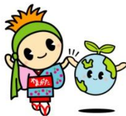
はながた ペニちゃん

春ですね。芽吹き季節です。 草木の小さな芽を見ると愛おしくなりますね。 「紅花そだて隊」の紅花もかわいい芽を出しました。 紅の蔵の中庭ですくすくと育てておりますので、 成長の過程をぜひ見にいってくださいね。